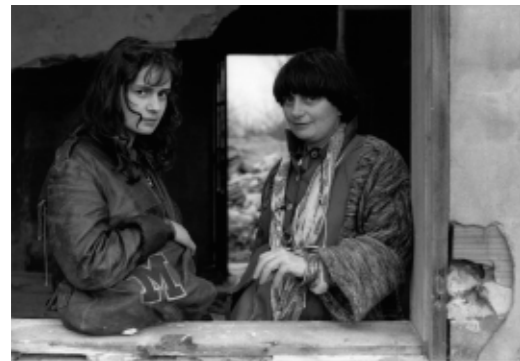
Sandrine Bonnaire et Agnès Varda